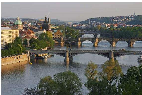
SPRÁVNÍ ČLENĚNÍ HL. M. PRAHY OD 1.7.2001 ADMINISTRATIVE BREAKDOWN OF PRAGUE FROM 1 JULY, 2001